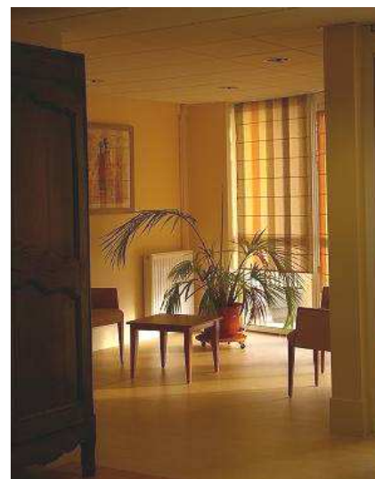
SALON SECTEUR AFRIQUE