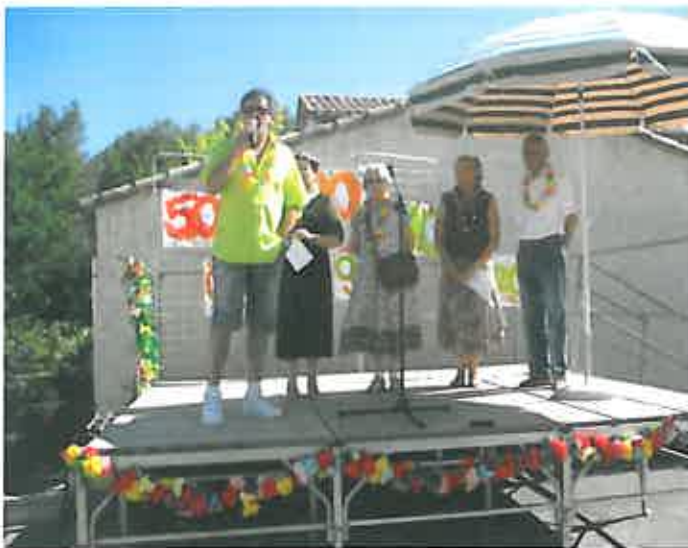
DISCOURS KERMESSE 2011