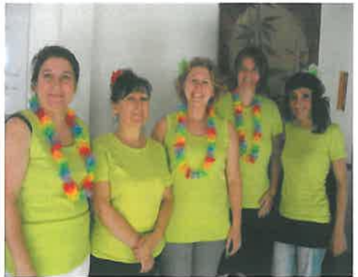
NOS CHARMANTES ANIMATRICES KERMESSE 2011

Un goûter festif avec boisson fraîche fut servi.